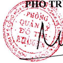
Đặng Mạnh Tuấn